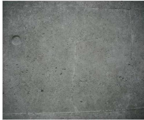
【 施 工 前 】